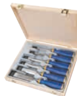
10503431 / 10503541