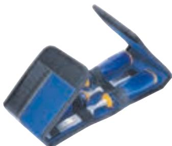
10503835 / 10503836